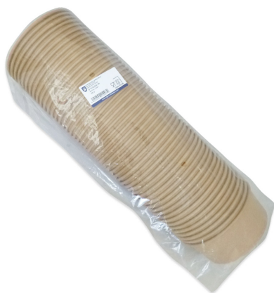
Image du paquet

210.28 COUVERCLES 212.98/99, 226.31/32/35/36/64 226.18 COUVERCLES 212.98/99, 226.31/32/35/36/64 233.41 COUVERCLES 212.98/99, 226.31/32/35/36/64 269.09 SÉPARATEUR SALADIER RÉF. 212.98 280.39 POTS À INSERER 280.40 POTS À INSERER 2 COMPART. 280.41 POTS À INSERER 3 COMPART. 280.70 COUVERCLES DOUBLE PAROI POUR SALADIERS