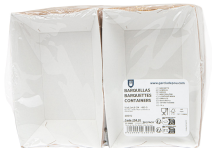
Image du paquet