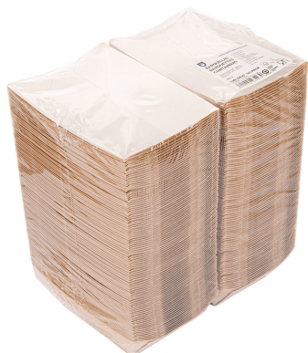
Image du paquet

Règlement (CE) n° 2023/2006 de la Commission du 22 décembre 2006 relatif aux bonnes pratiques de fabrication des matériaux et objets destinés à entrer en contact avec des denrées alimentaires.