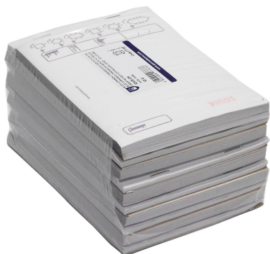
Image du paquet

Règlement (CE) n° 1907/2006 du Parlement européen et du Conseil du 18 décembre 2006 concernant l'enregistrement, l'évaluation, l'autorisation et la restriction des substances et préparations chimiques (REACH).