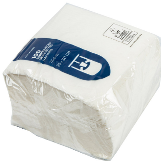
Image du paquet

Règlement (CE) n° 2023/2006 de la Commission du 22 décembre 2006 relatif aux bonnes pratiques de fabrication des matériaux et objets destinés à entrer en contact avec des denrées alimentaires.