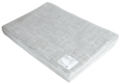
Image du paquet

Règlement (CE) n° 2023/2006 de la Commission du 22 décembre 2006 relatif aux bonnes pratiques de fabrication des matériaux et objets destinés à entrer en contact avec des denrées alimentaires.